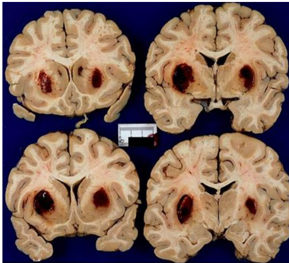
Trovanje metanolom-cerebralni edem ili nekroza bazalnih ganglia (kao kod Parkinsonizma-moguć oporavak)