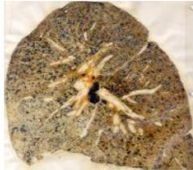
Silikoza pluća- Fibrozni granulomii