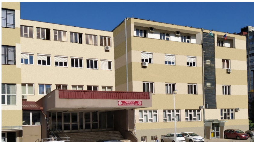
Слика 2. Зграда Факултета заштите на раду у Нишу

Простор који користи Факултет задовољава одговарајуће урбанистичке, техничко-технолошке и хигијенске услове и одговара броју студената који се тренутно школује.