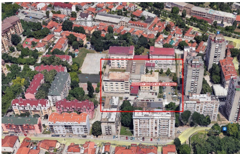
Слика 1. Локација Факултета заштите на раду у Нишу

Факултет заштите на раду у Нишу се налази на локацији Градске општине Палилула-Ниш, у ул. Чарнојевића 10а са укупном бруто површином 4375.24 m 2 сопственог простора.