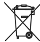
Slika 2: WEEE simbol

Proizvođači su dužni da obaveste potrošače o raspoloživim sistemima za separato sakupljanje, kao i o potencijalnim ekološkim i zdravstvenim rizicima od supstanci koje su sadržane u ostacima proizvoda na isteku njihove upotrebne vrednosti. Proizvođači su takođe u obavezi da pruže informacije kojima se olakšava ekološki prihvatljiv tretman otpada, kao i da obezbede identifikaciju komponenata i materijala, kao i lokaciju opasnih supstanci unutar proizvoda. Svi proizvodi moraju u skladu sa WEEE direktivom biti označeni propisanom, trajnom oznakom koja sugerise potrošačima da rashodovani aparat ne odlažu sa ostalim komunalnim otpadom (slika 2).